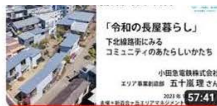
「令和の長屋暮らし」下北線路街にみるコミュニティのあたらしか...