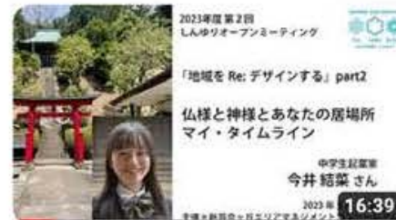
地域をRe:デザインする「仏様と神様とあなたの居場所 マイ・タイ...