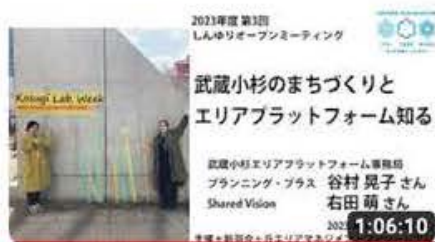
「武蔵小杉のまちづくりとエリアプラットフォーム」23年度第3回し...