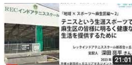
「地域×スポーツ～麻生区編～」【第2部】テニスという生涯スポーツ...