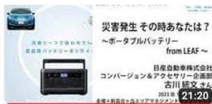
災害発生その時あなたは？～ポータブルバッテリーfrom LEAF～ 2...