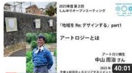
地域をRe:デザインする「アートロジ麻生」2023年度第2回しんゆり...