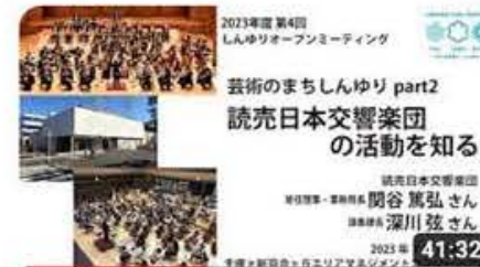
読売日本交響楽団の活動を知る 「芸術のまちしんゆり～劇団民藝...