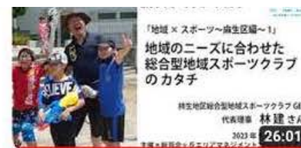
「地域×スポーツ～麻生区編～」【第1部】地域のニーズに合わせた総合...